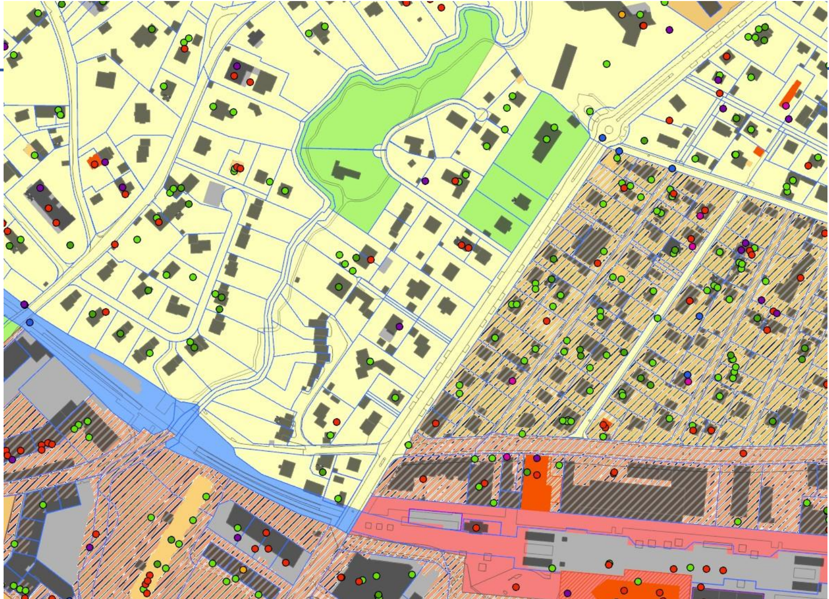
Plan des zones