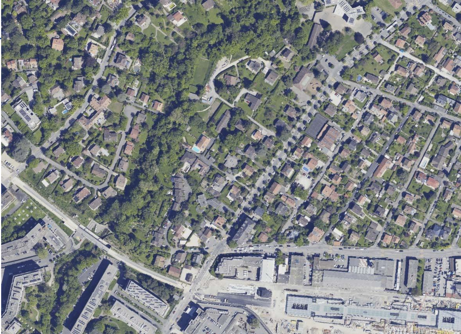
Vue, photographie aérienne du quartier